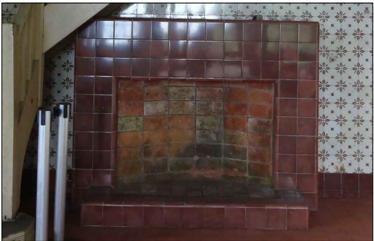
BEM IMÓVEL 1

TIPO: LAREIRA AMBIENTE: SALÃO OBSERVAÇÕES: LAREIRA REVESTIDA EM AZULEJOS DECORATIVOS DE COR MARROM DIMENSÕES: LARGURA 2,0M x ALTURA 1,70M X PROFUNDIDADE 0,45M CARACTERÍSTICAS: ESTRUTURA EM TIJOLOS COM A APLICAÇÃO DOS AZULEJOS COMO REVESTIMENTO; AZULEJOS DE 15X15CM