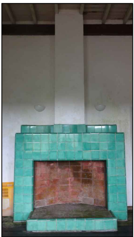
BEM IMÓVEL 2

TIPO: LAREIRA AMBIENTE: SALÃO OBSERVAÇÕES: LAREIRA REVESTIDA EM AZULEJOS DECORATIVOS DE COR MARROM DIMENSÕES: LARGURA 2,0M x ALTURA 1,70M X PROFUNDIDADE 0,45M CARACTERÍSTICAS: ESTRUTURA EM TIJOLOS COM A APLICAÇÃO DOS AZULEJOS COMO REVESTIMENTO; AZULEJOS DE 15X15CM