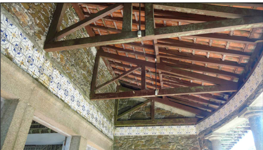
BEM IMÓVEL 5

TIPO: PAINÉIS DE AZULEJOS AMBIENTE: SALÃO ABERTO OBSERVAÇÕES: PAINÉIS DE AZULEJOS COM MOTIVOS REPETITIVOS PRODUZIDOS PELO ARTISTA PLÁSTICO E CERAMISTA JOSÉ WASTH RODRIGUES. DIMENSÕES: VARIADAS CARACTERÍSTICAS: ESTRUTURA EM PEDRAS COM A APLICAÇÃO DOS AZULEJOS COMO REVESTIMENTO; AZULEJOS DE 15X15CM