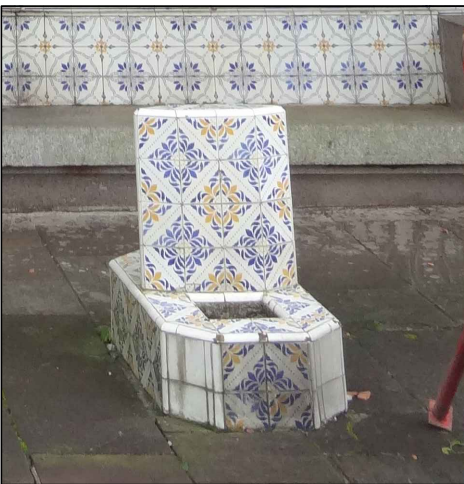
BEM IMÓVEL 4

TIPO: PAINÉL DE AZULEJOS AMBIENTE: PÁTIO OBSERVAÇÕES: PAINÉL DE AZULEJOS PRODUZIDOS PELO ARTISTA PLÁSTICO E CERAMISTA JOSÉ WASTH RODRIGUES. CONTÉM MAPA RODOVIÁRIO. DIMENSÕES: LARGURA 4,85M x ALTURA 1,45M DO MAPA CARACTERÍSTICAS: PAINÉL DE AZULEJOS VERTICAL FIXADOS SOBRE A ESTRUTURA DO IMÓVEL, ACIMA DE BANCO ESCULPIDO EM PEDRA; AZULEJOS DE 15X15CM.