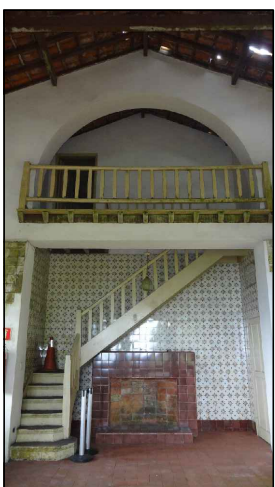
BEM IMÓVEL 6

TIPO: ESCADA DE MADEIRA AMBIENTE: SALÃO OBSERVAÇÕES: ESCADA EM MADEIRA COM PINTURA, REVESTIDA NAS PAREDES POR AZULEJOS COM MOTIVOS REPETITIVOS PRODUZIDOS PELO CERAMISTA JOSÉ WASTH RODRIGUES DIMENSÕES: LARGURA 0,80M X COMPRIMENTO 5,50M CARACTERÍSTICAS: AZULEJOS DE 15X15CM