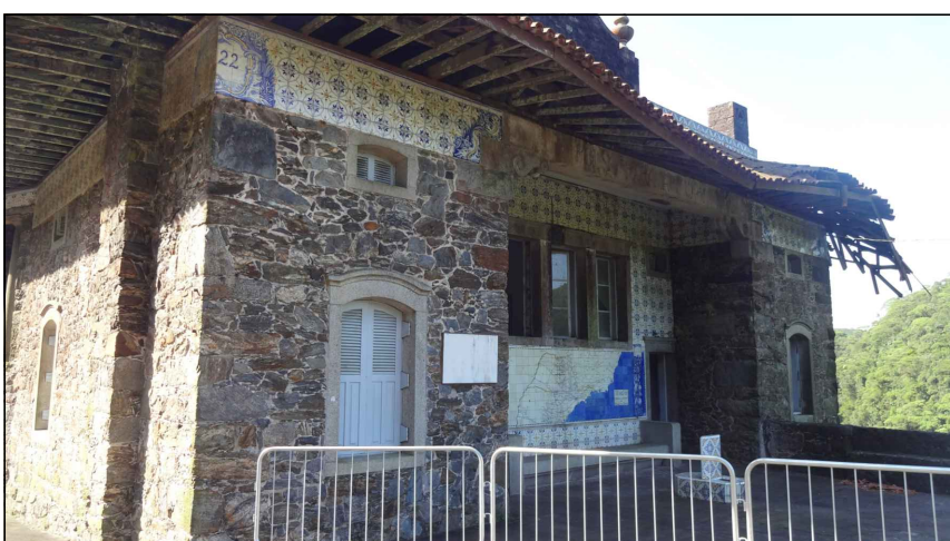
BEM IMÓVEL 8

TIPO: PAINÉIS DE AZULEJOS AMBIENTE: FACHADAS DA EDIFICAÇÃO OBSERVAÇÕES: PAINÉIS DE AZULEJOS COM MOTIVOS REPETITIVOS E MOTIVOS ÚNICOS PRODUZIDOS PELO ARTISTA PLÁSTICO E CERAMISTA JOSÉ WASTH RODRIGUES. DIMENSÕES: ALTURA 0,85M X COMPRIMENTOS VARIADOS CARACTERÍSTICAS: ESTRUTURA EM PEDRAS COM A APLICAÇÃO DOS AZULEJOS COMO REVESTIMENTO; AZULEJOS DE 15X15CM