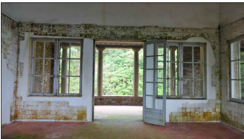
BEM IMÓVEL 7

TIPO: PAINÉIS DE AZULEJOS AMBIENTE: SALÃO OBSERVAÇÕES: PAINÉIS DE AZULEJOS COM MOTIVOS DIVERSOS OU REPETITIVOS PRODUZIDOS PELO ARTISTA PLÁSTICO E CERAMISTA JOSÉ WASTH RODRIGUES. DIMENSÕES: VARIADAS CARACTERÍSTICAS: APLICAÇÃO DOS AZULEJOS COMO REVESTIMENTO DA SALA, ALGUNS AZULEJOS FALTANTES; AZULEJOS DE 15X15CM