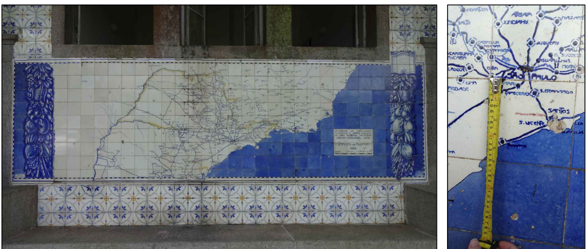
BEM IMÓVEL 3

TIPO: LAREIRA AMBIENTE: SALA MULTIUSO OBSERVAÇÕES: LAREIRA REVESTIDA EM AZULEJOS DECORATIVOS DE COR VERDE DIMENSÕES: LARGURA 2,00M x ALTURA 1,60M X PROFUNDIDADE 0,40M CARACTERÍSTICAS: ESTRUTURA EM TIJOLOS COM A APLICAÇÃO DOS AZULEJOS COMO REVESTIMENTO; AZULEJOS DE 15X15CM