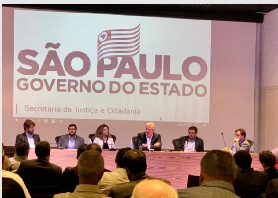
Na foto, audiência pública do projeto de concessão das linhas 8-Diamante e 9-Esmeralda da CPTM.