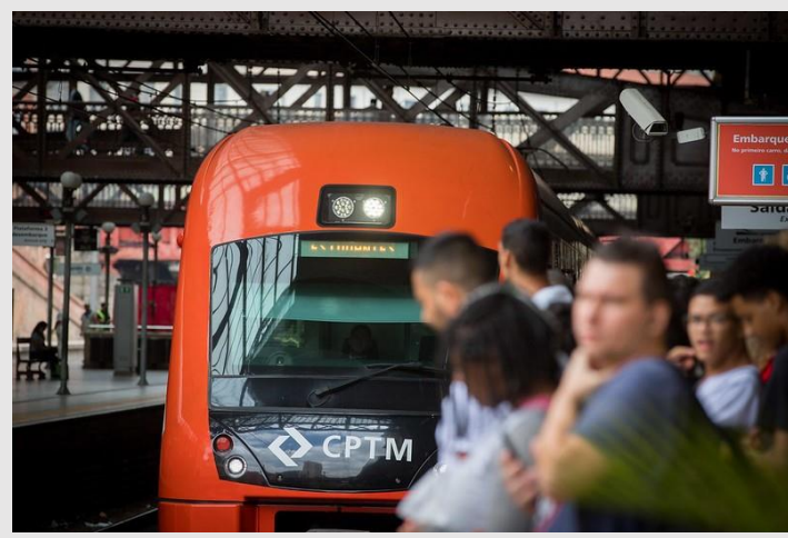
Na foto, estação da Linha 8-Diamante

Após ter sua modelagem final aprovada pelo Conselho Diretor do Programa Estadual de Desestatização (CDPED), foi publicado no dia primeiro de dezembro Edital, Contrato e demais documentos licitatórios da concessão das Linhas 8-Diamante e 9-Esmeralda. A publicação dos documentos é mais um passo do Governo do Estado de São Paulo na direção recuperação econômica pujante, garantido investimentos de mais de R$ 3 bilhões num modal limpo e eficiente de transporte urbano. O projeto desperta grande interesse do mercado nacional e internacional pela solidez da modelagem, elaborada através de constante diálogo com interessados, e incorporação de boas práticas internacionais. A sessão pública de abertura de envelopes está marcada para o dia 02 de março de 2021, na sede da Brasil Bolsa Balcão - B3 no endereço: Rua XV de Novembro, 275. Os documentos podem ser encontrados no link: http://sis.cptm.sp.gov.br/DataRoom/