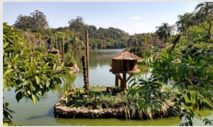
Na foto, área do Zoológico de São Paulo.

O Grupo deve assumir os espaços em até quatro meses. O projeto prevê ingressos gratuitos para crianças com até 4 anos de idade e para estudantes e professores da educação infantil, ensino fundamental e médio da rede pública de ensino, em dias específicos. O direito da meia-entrada também está garantido. As pesquisas e a conservação das espécies ameaçadas de extinção continuarão sob a responsabilidade do Governo do Estado, bem como as áreas de conservação do Parque Estadual Fontes do Ipiranga.