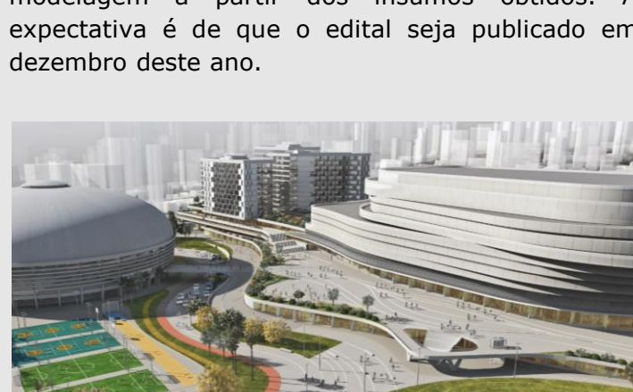
Na imagem, vista do projeto referencial da modelagem do complexo.

Aprovada pelo Conselho Diretor do Programa Estadual de Desestatização (CDPED) dia 31 de agosto, as Audiência e Consulta Públicas do projeto de concessão do Complexo Desportivo Constâncio Vaz Guimarães ocorrerão em ambiente virtual neste mês de setembro. Para consolidar a vocação de São Paulo como polo de eventos e entretenimento, a modelagem preliminar aprovada prevê a concessão de uma área de 92 mil m 2 para a construção de uma arena multiuso para 20 mil pessoas e investimentos em quadras e espaços de fruição pública gratuita por um período de 35 anos, com liberdade para exploração de diversos outros empreendimentos no local. Após as audiências e consultas públicas, serão feitos últimos ajustes na modelagem a partir dos insumos obtidos. A expectativa é de que o edital seja publicado em dezembro deste ano.